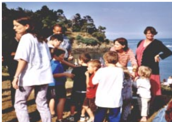
Les enfants et leurs encadrants lors du stage 2001 à Cancale.