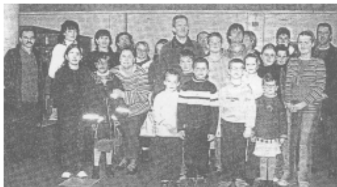
Les membres de l'Adepeda 29, lors de leur traditionnel rendez-vous de rentrée, hier, salle des conférences.

Dans un deuxième temps, l'Adepeda forme les parents qui le désirent au langage des signes. Tous les parents sont concernés, quelle que soit la structure éducative et la méthode qu'ils ont choisies pour leur enfants. Le langage des signes est un bon moyen d'avoir une communication normale avec l'enfant , souligne, en connaissance de cause, Michel Kerdilès. L'asso-