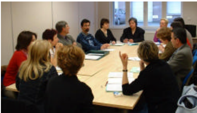
Les parents assidus au groupe de réflexion sur l'accessibilité aux différentes filières.