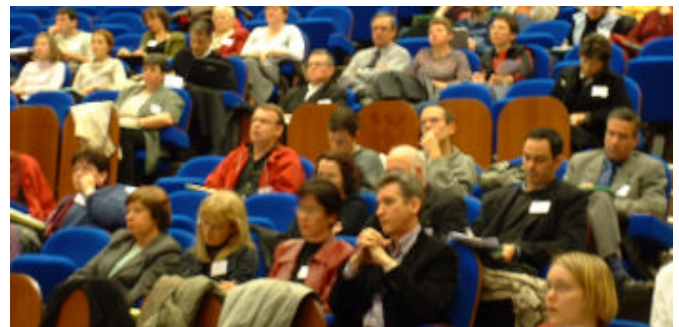
Un public attentif aux exposés européens